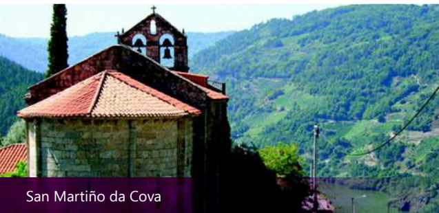
San Martiño da Cova

Lat. 42° 24' 35.7" N / Long. 7° 26' 36.9" O