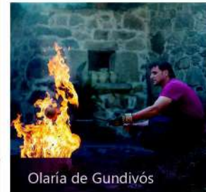
Olaría de Gundivós