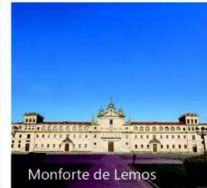
Monforte de Lemos