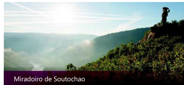
Miradoiro de Soutochao