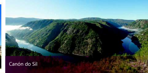
Canón do Sil