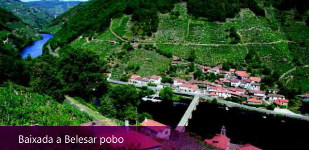
Baixada a Belesar pobo