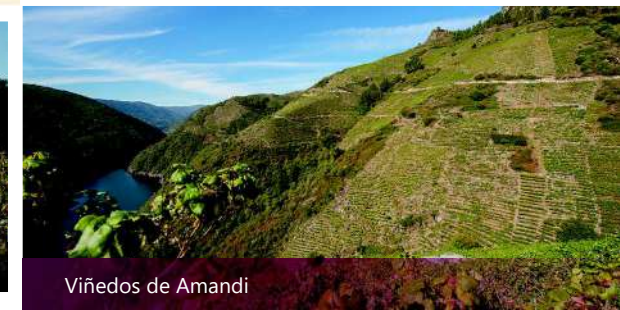
Viñedos de Amandi