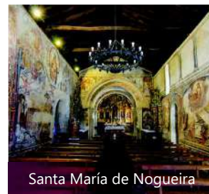
Santa María de Nogueira