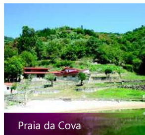
Praia da Cova